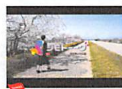
アイドル活動を応援