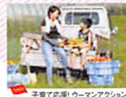
子育て応援! ウーマンアクション