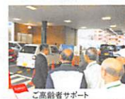
ご高齢者サポート

企業が地域に責任を持つことの必要性を痛感し広くご協力を募りました。 趣旨にご賛同頂いた皆様と“自治体支援チーム”を結成 住み続けられる街づくりへの挑戦をはじめました!