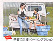
子育て応援!ウーマンアクション