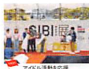
アイドル活動を応援