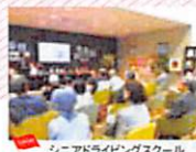
シニアドライビングスクール