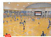
ABCバドミントン大会