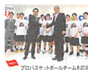
プロバスケットボールチームを応援