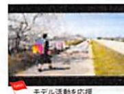
モデル活動を応援