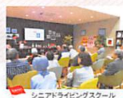
シニアライビングスクール