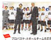
プロバスケットボールチームも応援