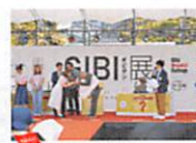
モデル活動を応援