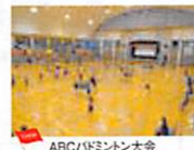
ABCバドミントン大会